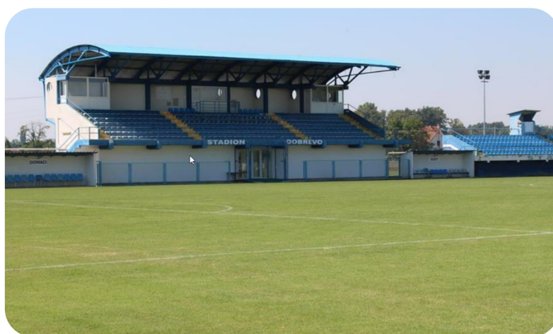
Stadion NK Slavonac, Stari Perkovci

Općina Vrpolje u svom vlasništvu ima tri nogometna igrališta; Ciglana, Stadion NK Mladost i Dobrevo. Općina Vrpolje održava nogometna igrališta u svome vlasništvu. Isto tako ima sklopljene ugovore s nogometnim klubovima u smislu održavanja zelenih površina putem kojih klubovi vrše uslugu održavanja istih i samim time ostvaruju se rashodi iz proračuna Općine Vrpolje.