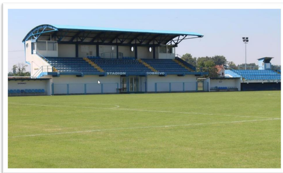
Stadion NK Perkovci, Stari Perkovci

Općina Vrpolje u svom vlasništvu ima tri nogometna igrališta; Ciglana, Stadion NK Mladost i Dobrevo. Općina Vrpolje održava nogometna igrališta u svome vlasništvu. Isto tako ima sklopljene ugovore s nogometnim klubovima u smislu održavanja zelenih površina putem kojih klubovi vrše uslugu održavanja istih i samim time ostvaruju se rashodi iz proračuna Općine Vrpolje.