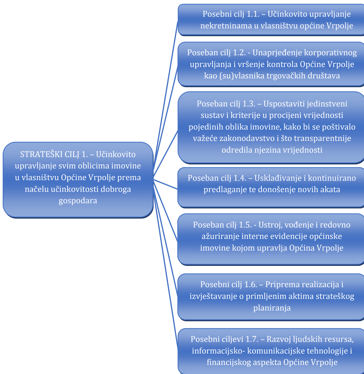
Slika 2. Kaskadiranje strateškog cilja upravljanja općinskom imovinom